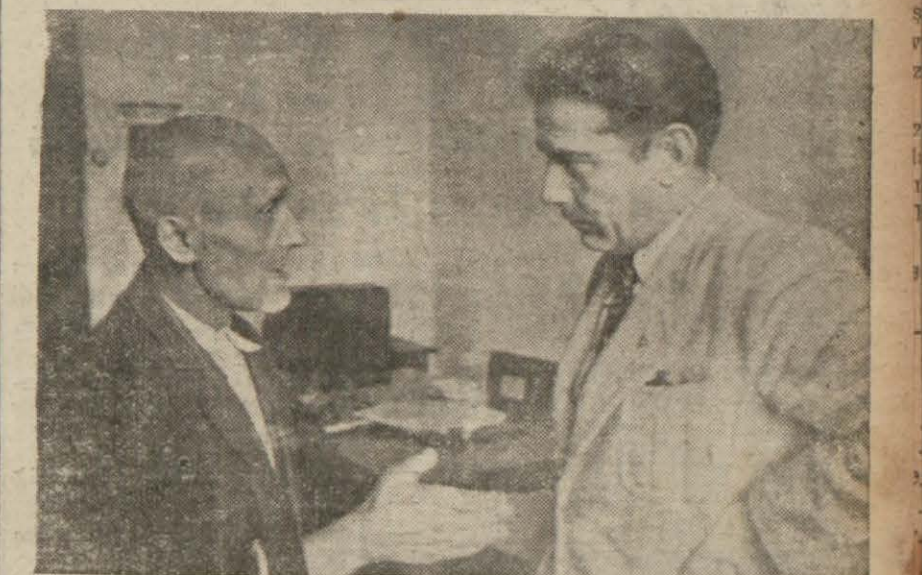
Nikola muharririmizle konuşurken

Üzerinde 1200 liradan fazla para bulundu, çocuklarından birini Amerikada, diğerini Atinada tahsil ettiriyormuş